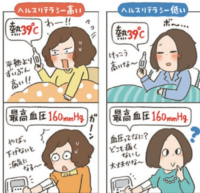
東京法規出版「人間ドック健診で手に入れる健康ライフ」 福田 洋監修