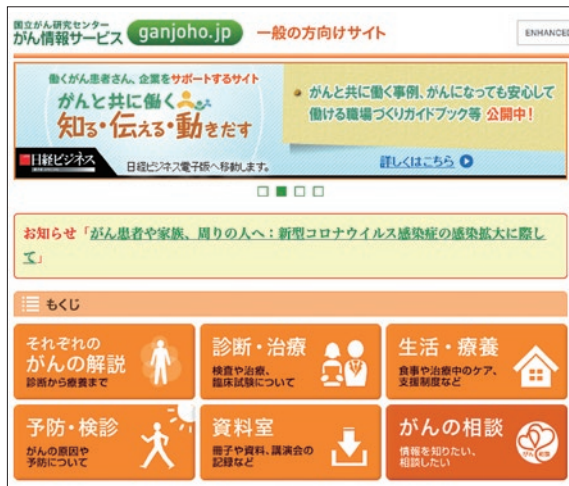
国立がん研究センター「がん情報サービス」 https://ganjoho.jp/