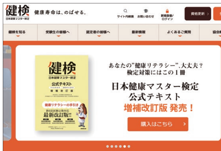
日本健康マスター検定「健検」 https://kenken.or.jp