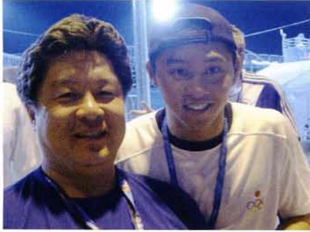
北島康介選手とともに

順天堂大学スポーツ健康科学部教授 順天堂医院整形外科・スポーツ診療科外来担当 (毎週月曜日午前)