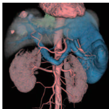
立体的に見る三次元画像

エックス線CTは体を金太郎飴のように輪切りにして調べる検査ですが、従来1列しかなかった検出器が64列もある最新の装置が当院には設置されています。検出器が多くなることで、広い範囲を一度に細かく見ることが可能になりました。これにより人体を立体的に見る三次元画像を作ることができ、皆さまの血管の状態や病気の拡がりを調べるのに役立っています。また動脈に管(カテーテル)を入れておこなう侵襲的な血管造影検査が省略できることも多くなってきています。検査を受ける時というのは何をされるのか不安なものです。わからないこと・知りたいことがございましたら、どうぞ放射線科のスタッフにお気軽にお尋ねください。