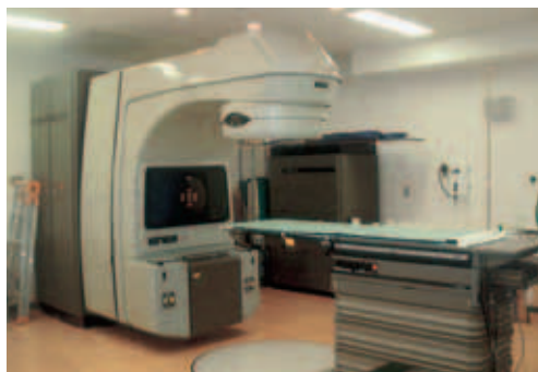
放射線治療装置 (リニアック)

がんの治療には3つの大きな柱があると考えられています。それは外科療法(手術)、化学療法(抗がん剤)と放射線療法です。がんの患者さまが治療の一環として放射線療法を受ける率は世界的には約50%で、欧米先進諸国ではさらに多いのですが、日本では今だ20%程度に留まっています。従って、今までは患者さまが放射線療法の優れた点を十分にご利用いただけていないことがありました。本邦で放射線療法の利用が少ない理由の一つに専門医の不足がありますが、順天堂医院には学会が認定する2人の専門医がおり、そのもとに適切な治療を行っています。近年、放射線療法の技術は飛躍的に進歩し、効果が高く副作用が少なくなっています。順天堂医院の放射線治療装置(リニアック)は世界最高水準で、専門医による綿密な治療計画のもと有効な治療が行えます。また、最近話題の前立腺がんに対するシードによる小線源療法も施行しています。がんにも有効で体に優しい治療として放射線療法をおすすめします。