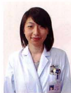
技術員 （ライトブルー）