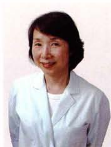
薬剤師 （ライトグリーン）