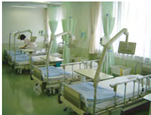
化学療法室の写真