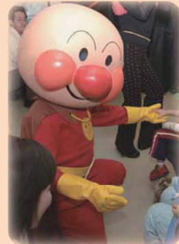
チャイルドパーティーにアンパンマン来訪