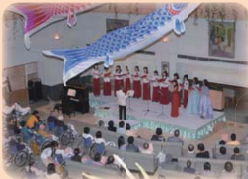
月一回行われる癒しの会の模様

今後は癒しの活動のみならず、皆様により快適に過ごしていただけるようなサポート活動が必要になってくると思いますので、将来的に、これが実現できればと考えております。