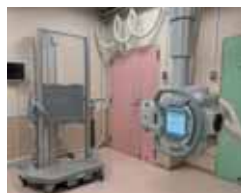
図2 全脊椎撮影用撮影室