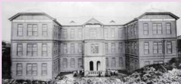
女子美術学校菊坂校舎